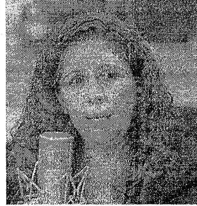
Ministra Esther Dweck

Um abril de 2022, quatro repórteres da Agência Pública mostraram que R$ 5,4 milhões do FNDE foram para aliados alagoanos de Lira, sob a capa do orçamento secreto.